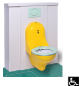
Habillage avec retour sur le côté droit ou gauche NORMES HANDICAPES WC SUSPENDU AVEC BATI

Pose du bâti-support Pose de l'habillage en stratifié post-formé